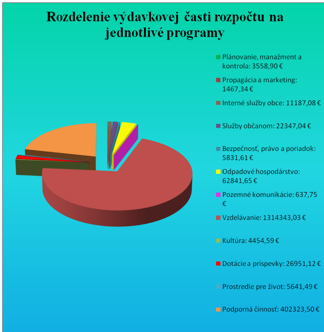
Graf č. 2: Plnenie výdavkovej časti rozpočtu k 30. 6. 2016 z hľadiska programov

Na základe Zákona č. 583/2004 Z. z. o rozpočtových pravidlách územnej samosprávy v znení neskorších predpisov obec zostavuje rozpočet výdavkov v programovej štruktúre. Výdavky obce sú v roku 2016 rozdelené do 12 programov.